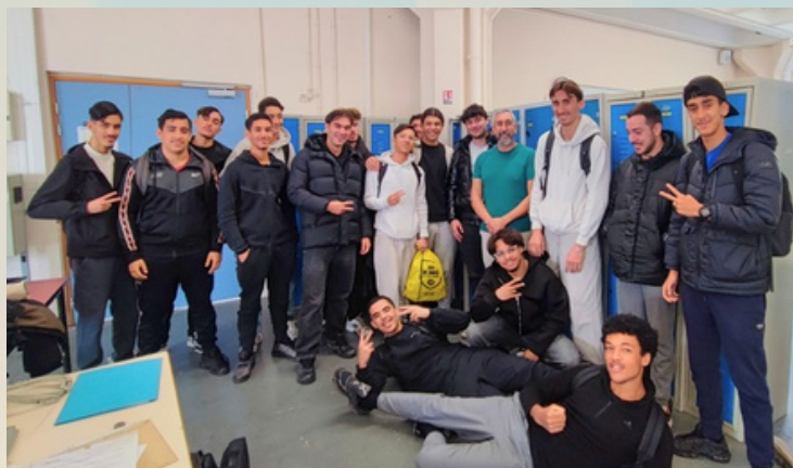
Terminale Maintenance Industrielle - Lycée Pierre Mendes France (Vitrolles)

Appréciés par le corps enseignant mais aussi par les élèves, nos interventions ont permis d'exposer un regard professionnel de terrain sur le marché du travail actuel, les différents modes de candidature et d'expliquer les attentes des employeurs du territoire Est Étang de Berre.