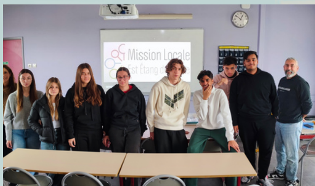
Terminale Microtechnique - Lycée Pierre Mendes France (Vitrolles)