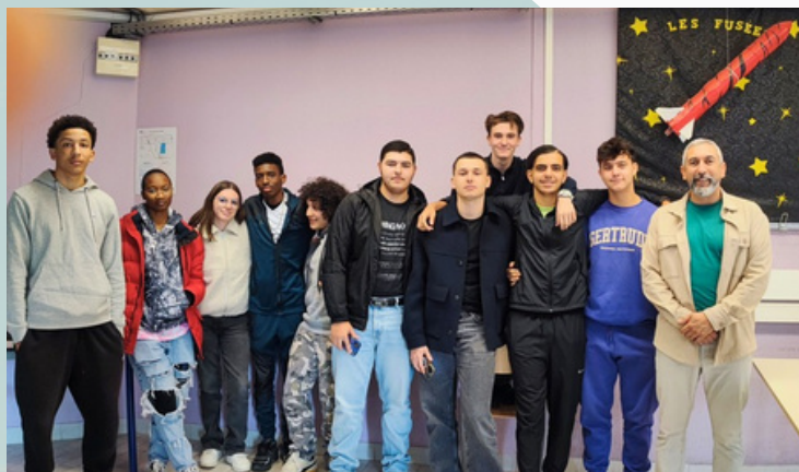
Terminale Microtechnique - Lycée Pierre Mendes France (Vitrolles)

Ces ateliers avaient également pour objectif d'apporter un soutien aux équipes éducatives, en les accompagnant dans leurs actions et en contribuant au renforcement des liens avec le milieu professionnel. Ils ont ainsi permis de favoriser les échanges, de développer une meilleure connaissance des réalités du monde du travail et de consolider les partenariats existants, au bénéfice des jeunes accompagnés.